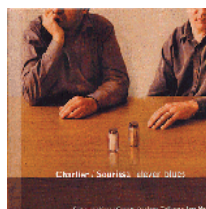
Eleven Blues (2004)